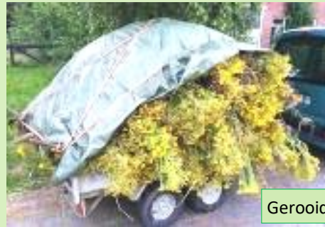
Gerooid Jacobskruid, eerste ronde: 470 kg

De overige werkzaamheden doen we later. Het programma voor de BURENDAG is gereed. De komende weken gaan we alles voorbereiden: o.a. grind, schelpen, bollen en gaas bestellen.