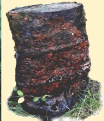
Monster van Loch Kostvlies machteloos op het droge.