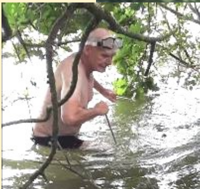
Chiel aan het peilen. Waar ligt het, hoe diep in de modder, hoe vast te maken? Zit er nog wat in?