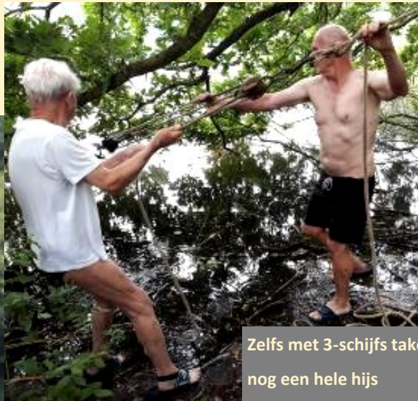
Zelfs met 3-schijfs takelwerk nog een hele hijs