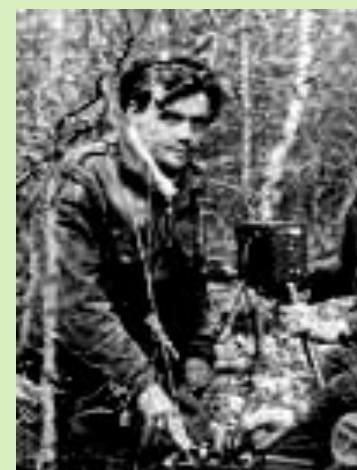
Foto van onbekende Franse parachutist met radioapparatuur in het bos bij Gasselte/Gieten. April 1945