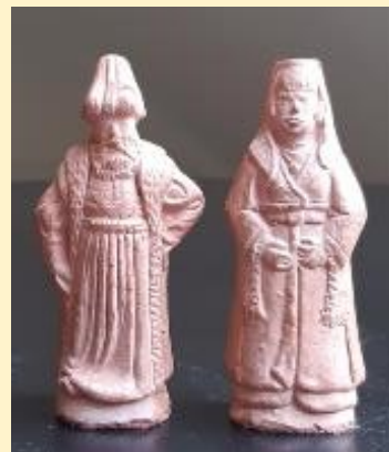
Turkse schaakstukken ca. 1990

- "Dat verklaart het verschil in bewegelijkheid tussen koning en