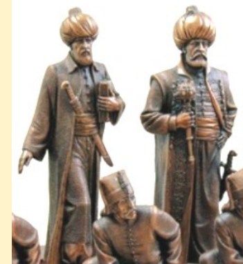
Vizier naast vorst. Arabische, (Perzische?) schaakstukken

Men kan zich, heiden of gelovige, onbezorgd wijden aan een potje schaak. Vanuit een doosje overspant dit avontuur de eeuwen, van Perzië in de oudheid tot en met Kostvliet in het digitale tijdperk. Al of niet met whisky en een haring.