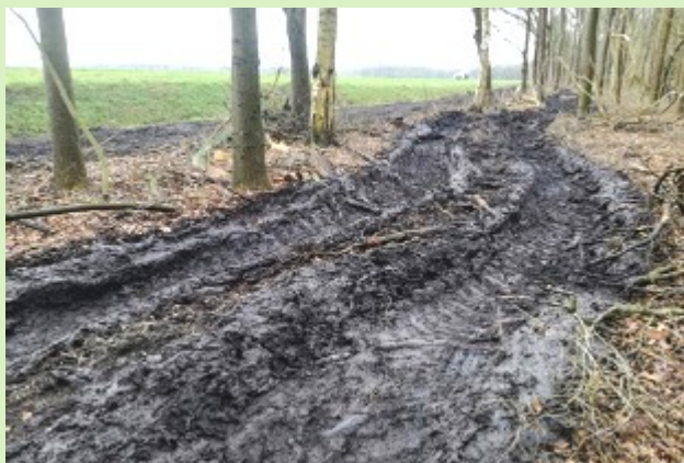
De kaalslag in het Hamerlanderhout

Hoe gaat de Gemeente dit herstellen en oplossen?