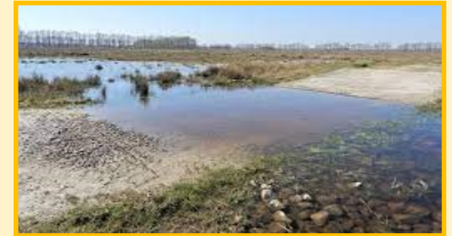
Voorde in het Mantingerveld

Elders in het veen moest je het hebben van plekken waar de veenlaag dun was. Zo'n doorwaadbare plek op zandondergrond noemde men toen (en nu nog) een voorde . Vandaar Gieter- en Eexterzandvoort.