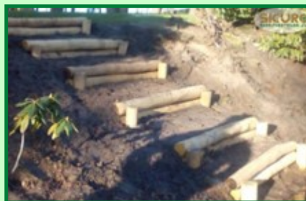
Stammen ter vervanging van grindtegels

- Klimtoren. In de zuidwesthoek zal een klimtoren (1,5 m.) verrijzen met uitzicht op het water.