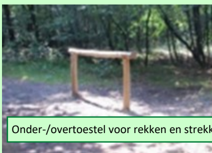
Onder-/overttoestel voor rekken en strekken