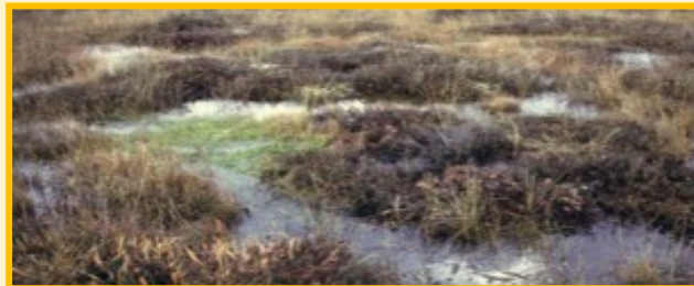
Moeilijk toegankelijk gebied

Even info voor wie opgegroeid is met senseo en HR-ketels: turf heeft ons honderden jaren van brandstof voorzien om ons mee te verwarmen en om op te koken.