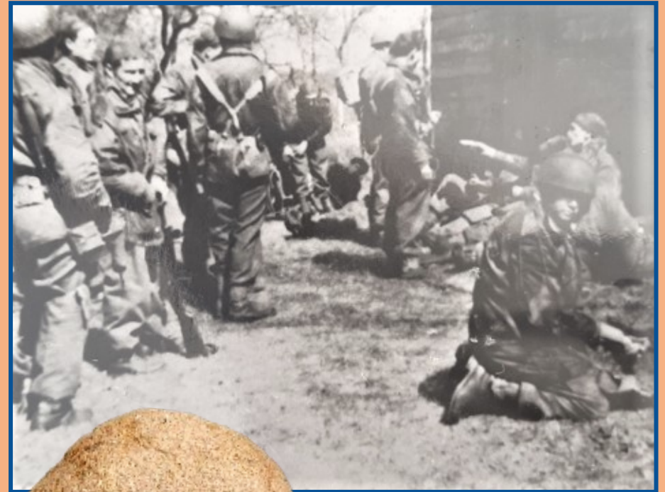
Fransen parachutisten in de buurt van Gieten/Gasselte. 1945