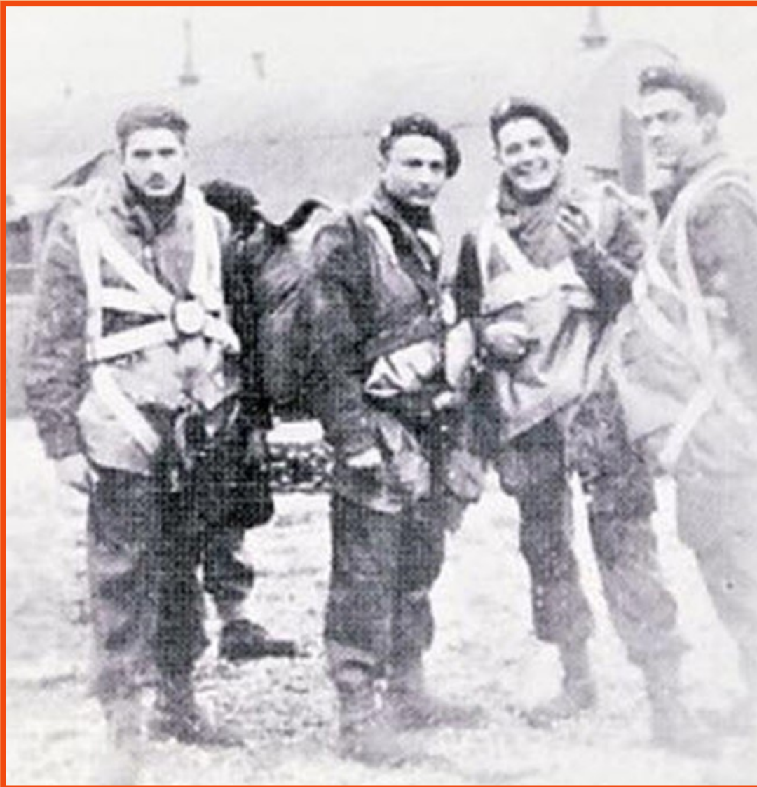
Fransen parachutisten in Drenthe, april 1945