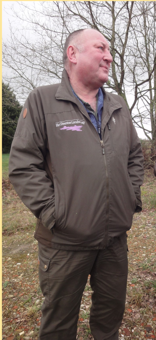
‘Energie door enthousiasme’

‘Het bosgevoel zat er bij mij al vroeg in. Ik groeide op in Gasselte en als ik de straat uitliep zat ik midden in de natuur.’