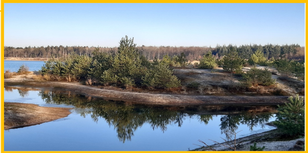
Gasselternveld, herfst 2020. Hoezo 'veld'?

Elk dorpsgebied bevatte naast essen en groengronden, nog een element namelijk het veld . Dat gold als 'onverdeeld' d.w.z. gemeenschappelijk gebied. Het was van niemand en van iedereen ; het viel onder de boermarke.