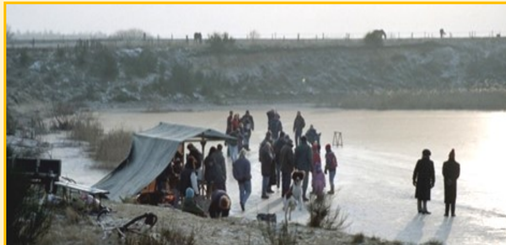
Situatie februari 1995 Oever nog intact en in gebruik bij oeverzwaluwen; toen wel wat kaler. Witte stip (midden) is bord: BROEDPLAATS NIET VERSTOREN.