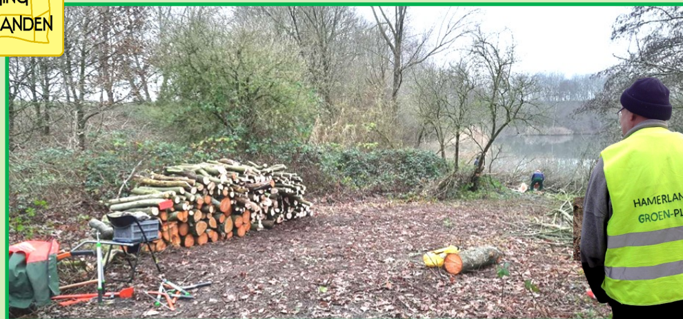
Stammen en takken bereikbaar gepositioneerd voor een trekker met takkenhakselaar