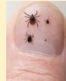
De vier stadia in ontwikkeling van de teek (ei, larve, nimf, volwassen insect).

Wit vlees van gevogelte, kippen en ander pluimvee en vis veroorzaakt geen problemen.