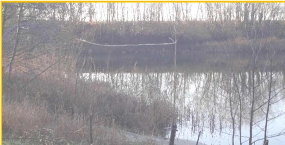
Situatie Kerst 2020 Relatieve hoge waterstand door recente extreme neerslag: oever minder hoog. Bebossing toegenomen (evenals de gemiddelde jaartemperatuur).